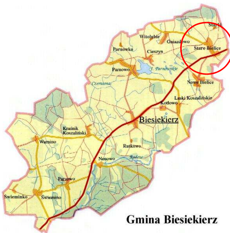
Rysunek 1. Położenie miejscowości w gminie.

Miejscowość Stare Bielice to wieś sołecka położona w województwie zachodniopomorskim, w powiecie koszalińskim, w północno-wschodniej części gminy Biesiekierz. Wieś położona jest w odległości około 7 km na północny-wschód od Biesiekierza (siedziby władz gminy), około 5 km od Koszalina (siedziby władz powiatu) oraz około 153 km od Szczecina (siedziby władz województwa). Lokalizację miejscowości na tle gminy przedstawia rysunek poniżej.