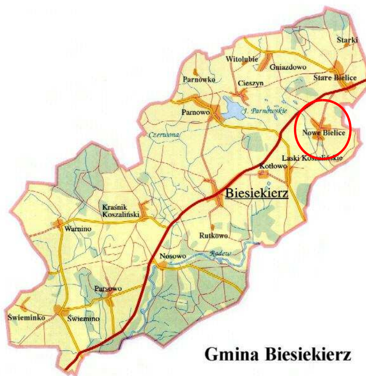
Rysunek 1. Położenie miejscowości w gminie.

Miejscowość Nowe Bielice to wieś sołecka położona w województwie zachodniopomorskim, w powiecie koszalińskim, w północno-wschodniej części gminy Biesiekierz. Wieś położona jest w odległości około 7 km na północny-wschód od Biesiekierza (siedziby władz gminy), około 5 km od Koszalina (siedziby władz powiatu) oraz około 153 km od Szczecina (siedziby władz województwa). Lokalizację miejscowości na tle gminy przedstawia rysunek poniżej.