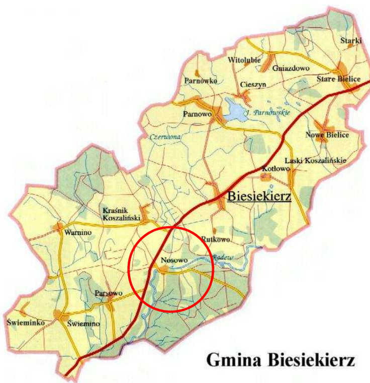
Rysunek 1. Położenie miejscowości w gminie.

Miejscowość Nosowo to wieś położona w województwie zachodniopomorskim, w powiecie koszalińskim, w południowo-zachodniej części gminy Biesiekierz, należąca do sołectwa Kraśnik Koszaliński. Wieś położona jest w odległości około 5 km na północny-zachód od Biesiekierza (siedziby władz gminy), około 18 km od Koszalina (siedziby władz powiatu) oraz około 149 km od Szczecina (siedziby władz województwa). Lokalizację miejscowości na tle gminy przedstawia rysunek poniżej.