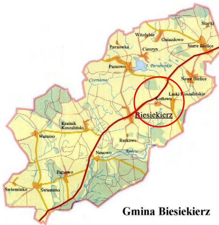
Rysunek 1. Położenie miejscowości w gminie.

Miejscowość Kotłowo to wieś położona w województwie zachodniopomorskim, w powiecie koszalińskim, w południowo-zachodniej części gminy Biesiekierz do 31 grudnia 2009 r. była to miejscowość należąca do sołectwa Laski Koszalińskie. Od 1 stycznia 2010 r. miejscowość ta jest miejscowością sołecką. Wieś położona jest w odległości około 2 km na północny- wschód od Biesiekierza (siedziby władz gminy), około 10 km od Koszalina (siedziby władz powiatu) oraz około 153 km od Szczecina (siedziby władz województwa). Lokalizację miejscowości na tle gminy przedstawia rysunek poniżej.