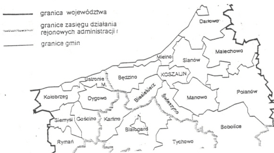
Rys. 1 Położenie geograficzne Gminy Biesiekierz

Gmina Biesiekierz leży w północnej części województwa koszalińskiego, w pobliżu morza, na trasie Szczecin - Gdańsk, granicząc bezpośrednio z Koszalinem oraz gminami: Świeszyno, Białogard, Karlino i Będzino. Geograficznie Gmina Biesiekierz należy do Pobrzeża Zachodnio-Pomorskiego.