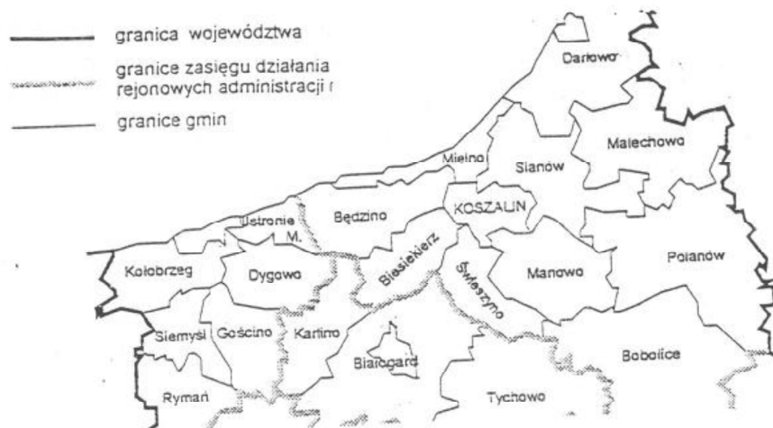
Rys. 1 Położenie geograficzne Gminy Biesiekierz

Gmina Biesiekierz leży w północnej części województwa koszalińskiego, w pobliżu morza, na trasie Szczecin - Gdańsk, granicząc bezpośrednio z Koszalinem oraz gminami: Świeszyno, Białogard, Karlino i Będzino. Geograficznie Gmina Biesiekierz należy do Pobrzeża Zachodnio -Pomorskiego.